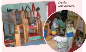
Crèche Jean Bernard.