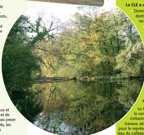
La Grande Ile.