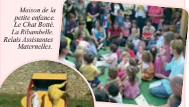
Maison de la petite enfance. Le Chat Botté. La Ribambelle. Relais Assistants Maternelles.