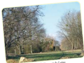
Aqueduc de la Vanne et du Loing.

L'enjeu est d'instaurer un mode de gestion harmonieux et pérenne de notre territoire et de notre espace qui ne fasse pas peser demain, sur nos descendants, les conséquences de nos choix d'aujourd'hui.