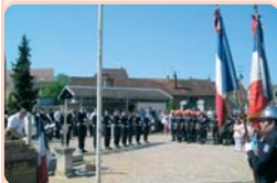
Hommage aux 600 000 victimes civiles et militaires.