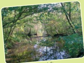
La Grande Ile.

Une gouvernance écologique s'exerce dorénavant à Mennecey. Nous invitons chacun d'entre vous à y participer afin de lui donner tout son sens.