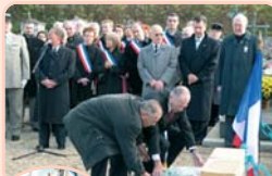
Intense recueillement en mémoire des 1 500 000 Français morts au Champ d'Honneur.