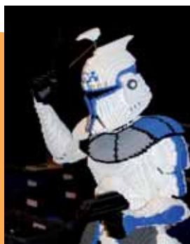
4 et 5 mai Exposition géante Lego Plus de 5 000 amateurs et passionnés des briques Lego ont visité le Festi's Brick Trip !