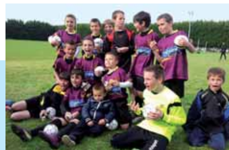
L'équipe U10-U11 "Champions de l'Essonne"