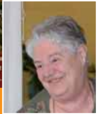
14 mai Anniversaires des résidents de Gauraz Un moment de convivialité très apprécié.