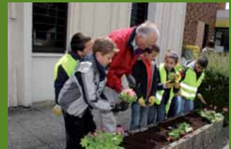
Des jardiniers en herbe attentifs et motivés !

On recherche des bénévoles pour participer à l'exploitation de ces potagers. En remerciement, ils pourront bénéficier des récoltes !