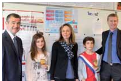
Visite de Franck Marlin dans la classe lauréate le 18 avril.