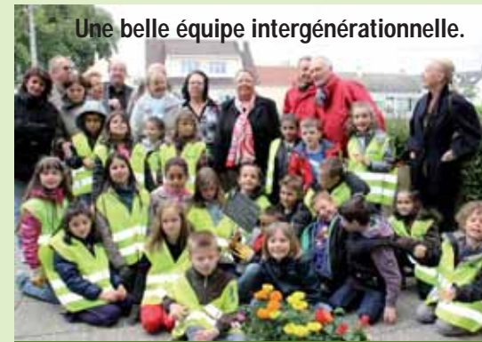
Une belle équipe intergénérationnelle.

Cette tour-nichoir, comptant 42 nids, a représenté un coût de 15 000 € qui a été financé à hauteur de 7 000 € par la Région Ile-de-France et de 2 000 € par le bailleur social « Toit et Joie », qui avait procédé à la démolition de l'ancienne maison de retraite.