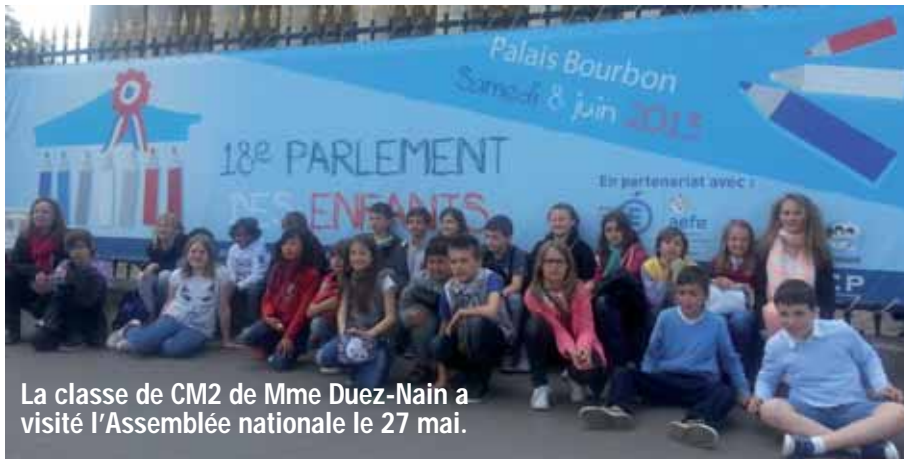
La classe de CM2 de Mme Duez-Nain a visité l'Assemblée nationale le 27 mai.