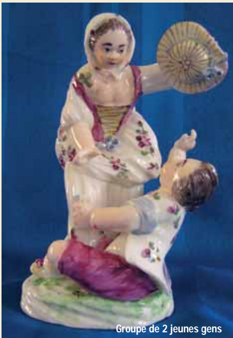
Groupe de 2 jeunes gens