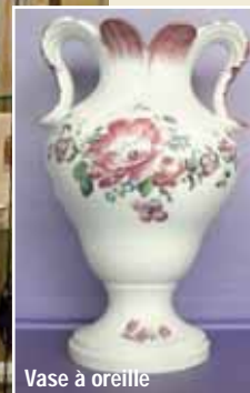
Vase à oreille