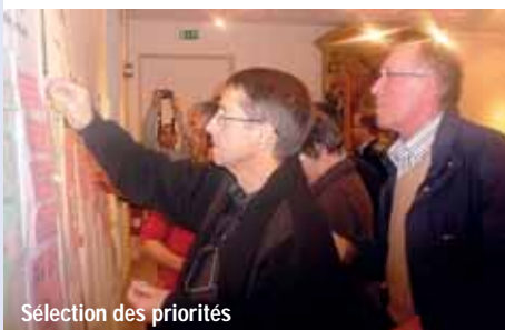
Sélection des priorités