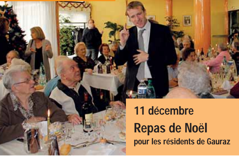
11 décembre Repas de Noël pour les résidents de Gauraz