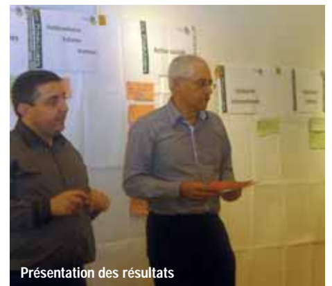
Présentation des résultats