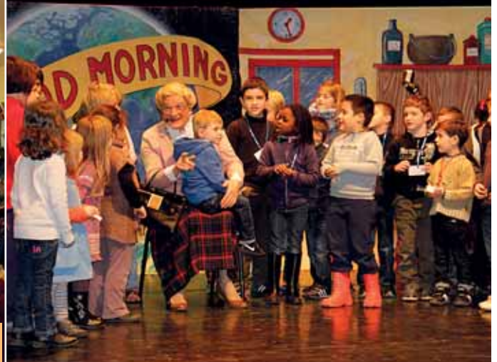
12 décembre Noël des enfants du personnel municipal et du centre de loisirs