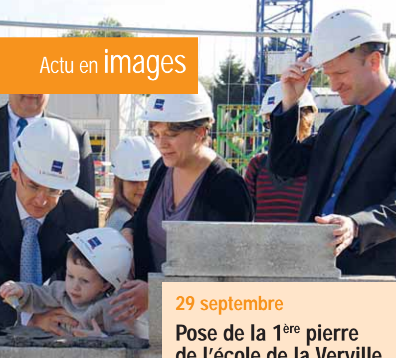
29 septembre Pose de la 1 ère pierre de l'école de la Verville