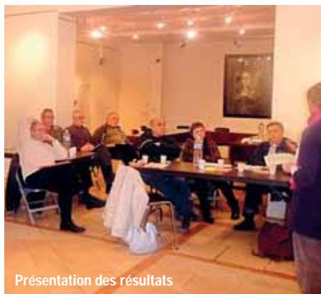
Présentation des résultats