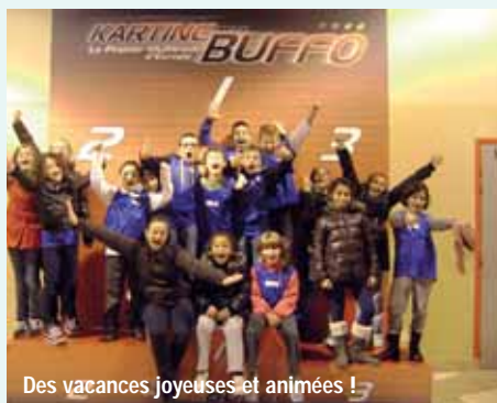
Des vacances joyeuses et animées !

Le centre de loisirs Joseph Judith sera réservé aux enfants âgés de 6 ans à 12 ans, avec une capacité d'accueil de 135 places. Il prend la dénomination Centre de loisirs "Primaires" Joseph Judith.