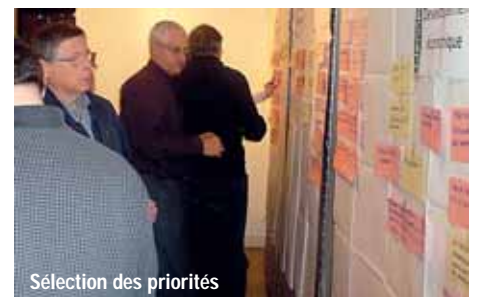
Sélection des priorités