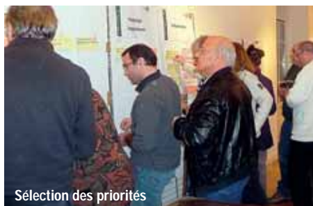
Sélection des priorités