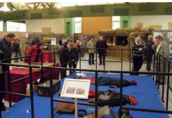
9 au 13 novembre Exposition sur la Grande Guerre Beau succès pour cette 1 ère exposition qui a accueilli 1750 visiteurs dont 660 scolaires (15 classes du CE2 à la 3 ème )