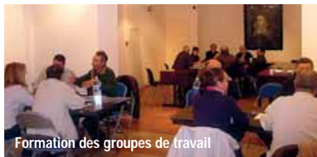
Formation des groupes de travail