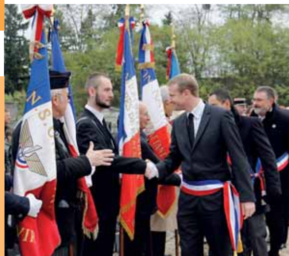
11 novembre Commémoration de l'armistice du 11 novembre 1918 célébrée conjointement et successivement à Fontenay le Vicomte, Ormoy et Mennecy