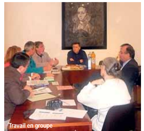
Travail en groupe