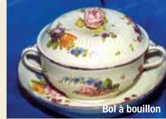
Bol à bouillon

En 1734, le céramiste François Barbin s'installe à Villeroy sous la protection du duc Louis François Anne de Neufville. Il produit des pièces en porcelaine dite « tendre », ne contenant pas de kaolin. La cassure en est cristalline et la couverte fragile se raye facilement au couteau. Le décor peint traduit le Siècle des Lumières et les jolis bouquets champêtres voisinent avec les thèmes d'Extrême-Orient.