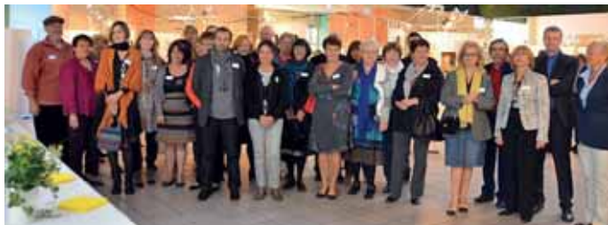
29 septembre Vernissage du Salon du Petit format "Les Artistes de notre région"