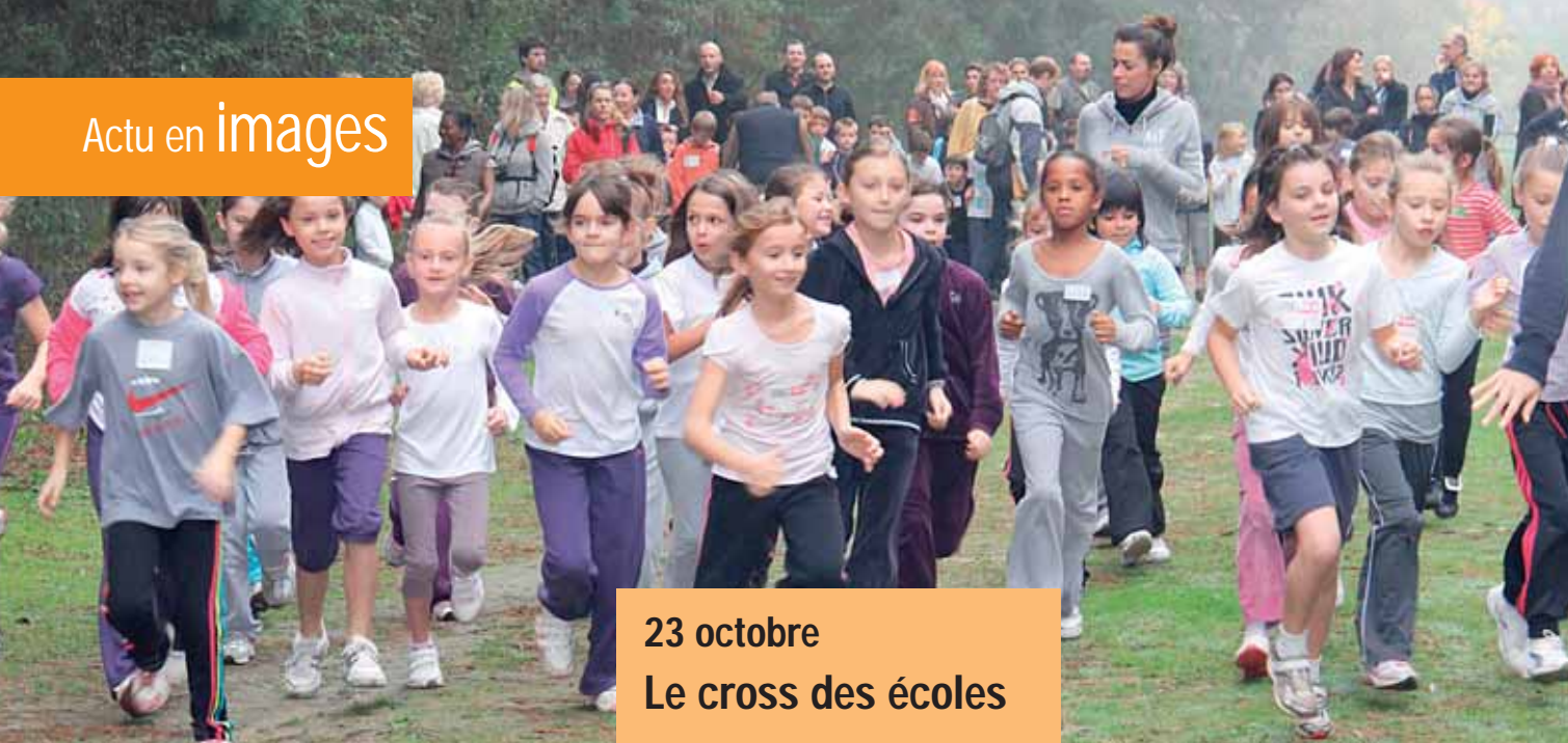
23 octobre Le cross des écoles

1 er au 4 novembre mise en place du pont-rail de la future déviation qui permettra la suppression du passage à niveau de la gare.