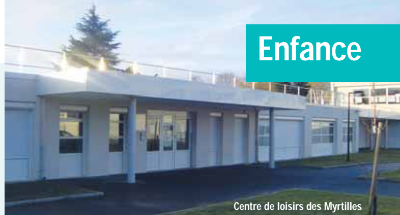
Centre de loisirs des Myrtilles

L'accroissement à venir de la population menneçoise, consécutif aux programmes immobiliers en cours de réalisation, a fait l'objet d'une anticipation calculée et organisée sur les différents services de la ville.