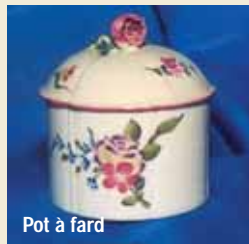
Pot à fard

La Municipalité, consciente de l'intérêt culturel de cette production locale, recherchée par les amateurs de la