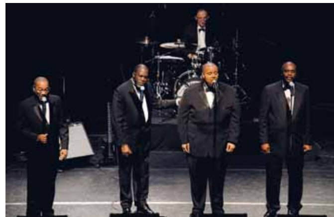
16 décembre Concert Golden Gate Quartet