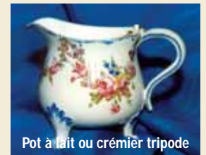
Pot à lait ou crémier tripode

d'acquisitions faites au fil des ans, mais sont aussi l'expression de dons généreux de citoyens attachés au riche passé culturel de notre commune.