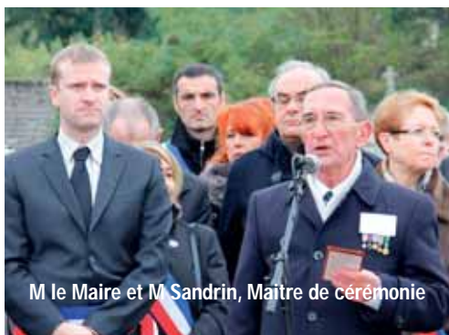
M le Maire et M Sandrin, Maître de cérémonie