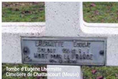
Tombe d'Eugène Lhermitte Cimetière de Chattancourt (Meuse)

Un DVD montrant les sépultures des Menneçois morts pour la Patrie, réalisé dans les cimetières civils et les nécropoles militaires de France et de Belgique, sera offert à chaque souscripteur.