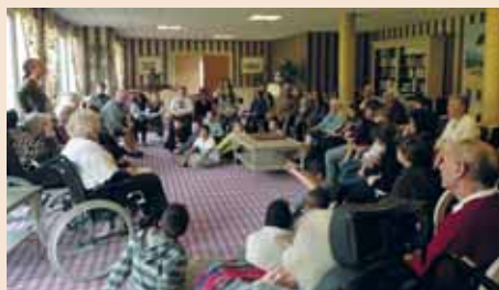
Rencontre avec les élèves de l'école de la Jeannotte