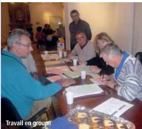
Travail en groupe