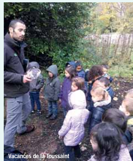
Vacances de la Toussaint