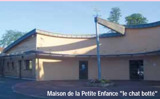
Maison de la Petite Enfance "le chat botté"

La municipalité développe depuis plus de trente ans la création de places en crèche sur son territoire. Elle dispose aujourd'hui de 125 places de crèche accompagnées, financièrement, par les aides de la Caisse d'allocations familiales et du Conseil général, qui représentent 50% du coût global de la petite-enfance sur la ville.