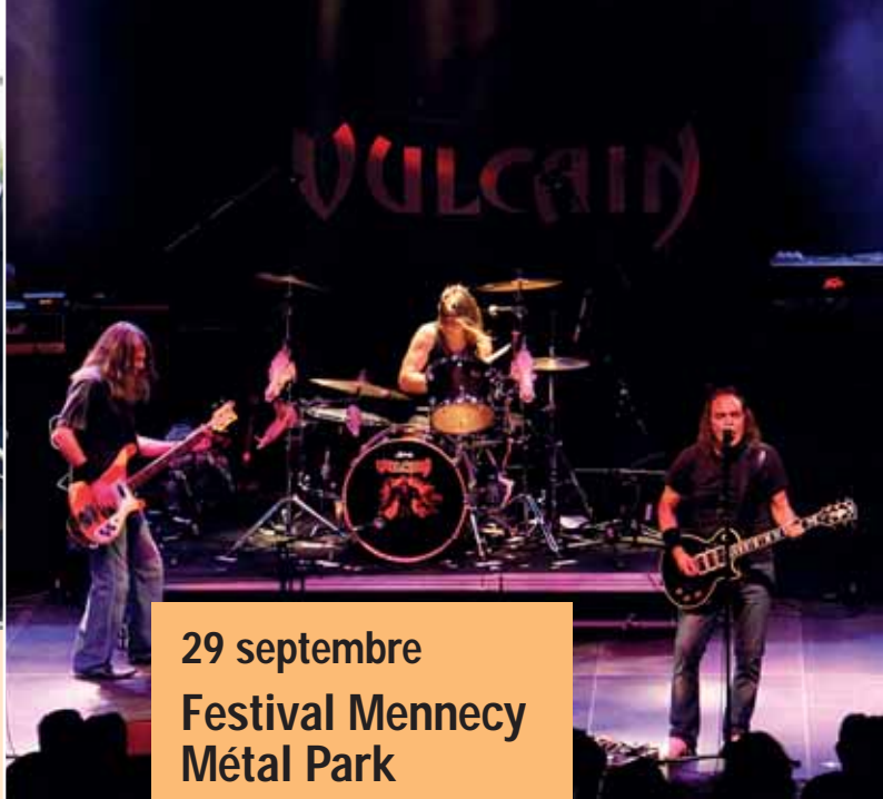
29 septembre Festival Mennecey Métal Park Vulcain