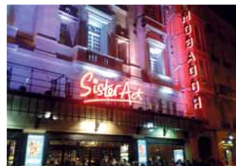
9 novembre Sister Act au Théâtre Mogador avec le Pôle loisirs Découvertes