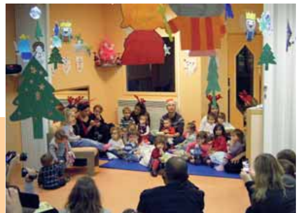
18 décembre Fête de Noël à la crèche Jean Bernard