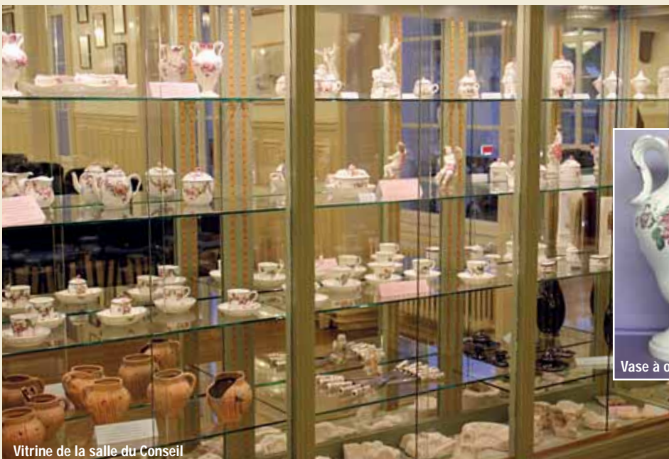
Vitrine de la salle du Conseil

contacter le Cabinet du Maire tél 01.69.90.80.31.