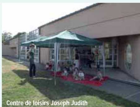
Centre de loisirs Joseph Judith

Cela permettra à la ville de bénéficier d'aides complémentaires de la Caisse d'allocations familiales, dans le cadre du contrat enfance jeunesse qui sera renouvelé pour 4 ans à compter de janvier 2013.