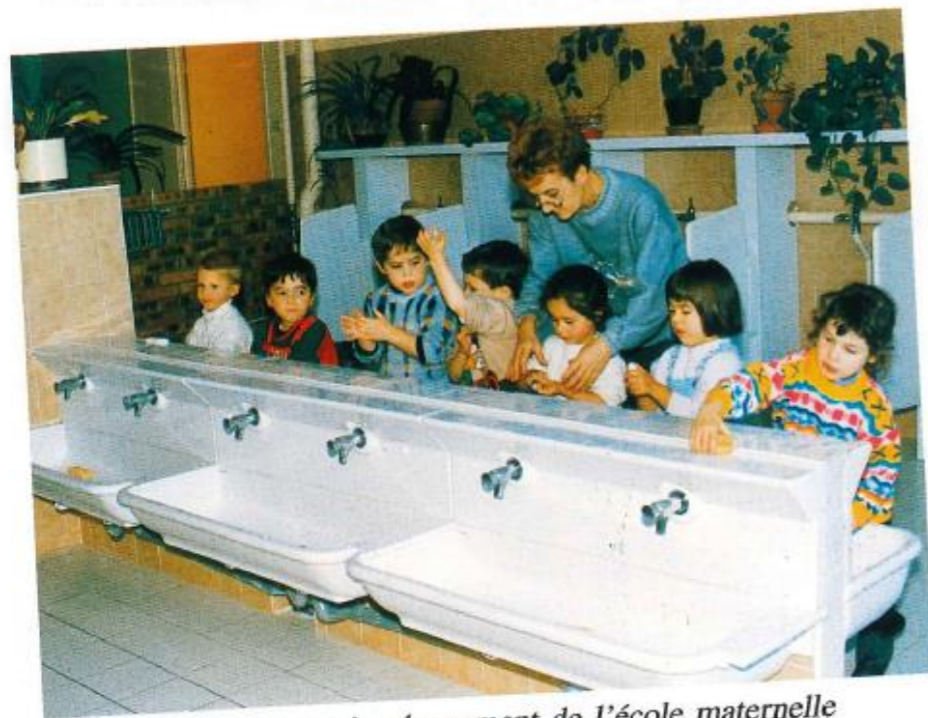
Extension et réaménagement de l'école maternelle de la Jeannotte