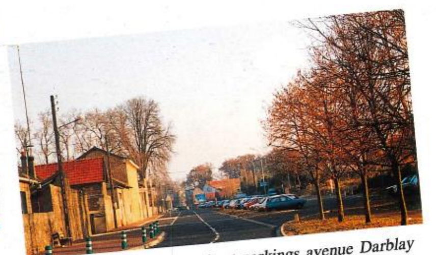
Aménagement des abords et parkings avenue Darblay