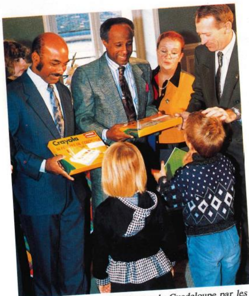
Remise des prix du concours sur la Guadeloupe par les représentants du Conseil Général de la Guadeloupe.