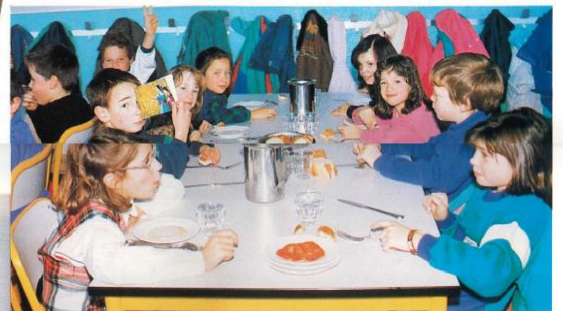
Réhabilitation et changement du mobilier au restaurant Municipal de la Jeannotte.