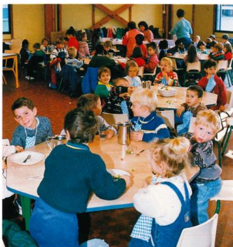
Agrandissement des locaux et changement du mobilier à l'école de la Jeannotte