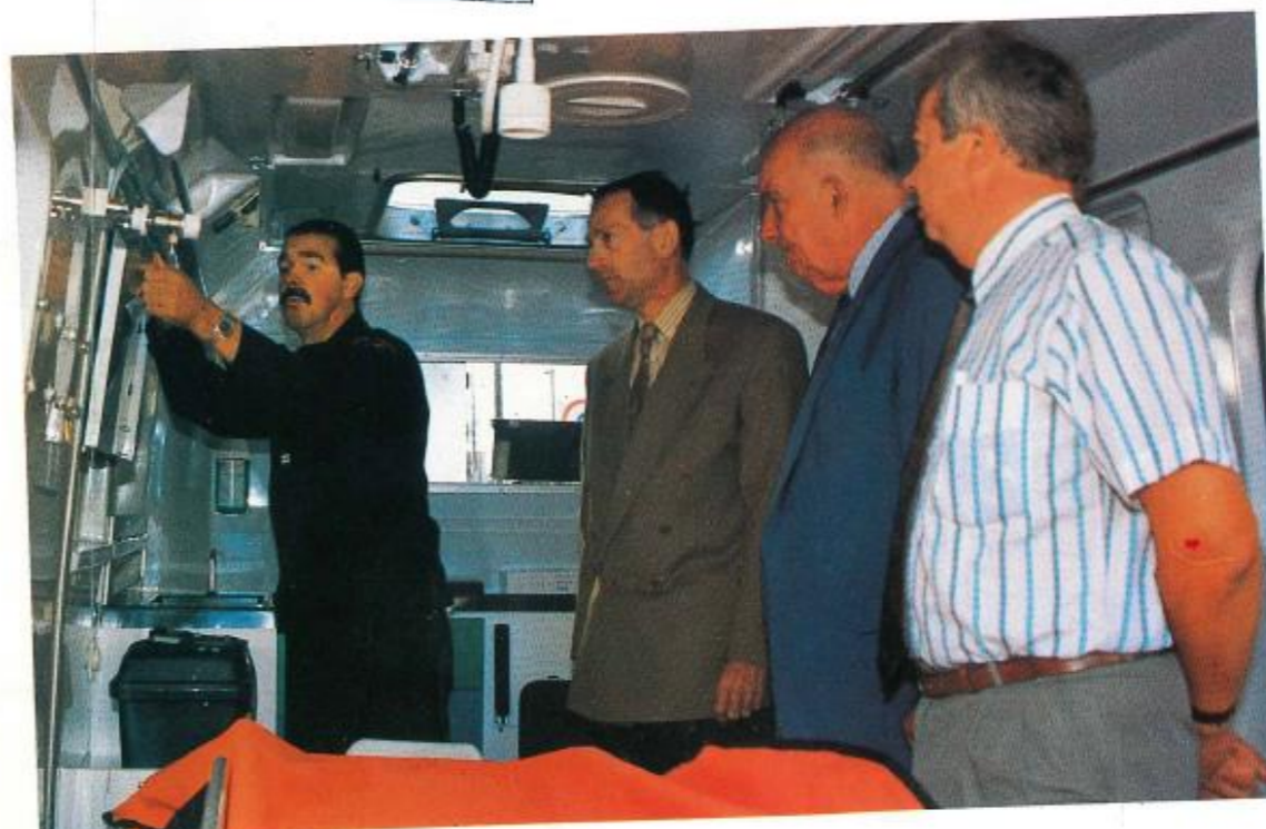
Nouveaux matériels pour nos pompiers. Présentation du VSAB.