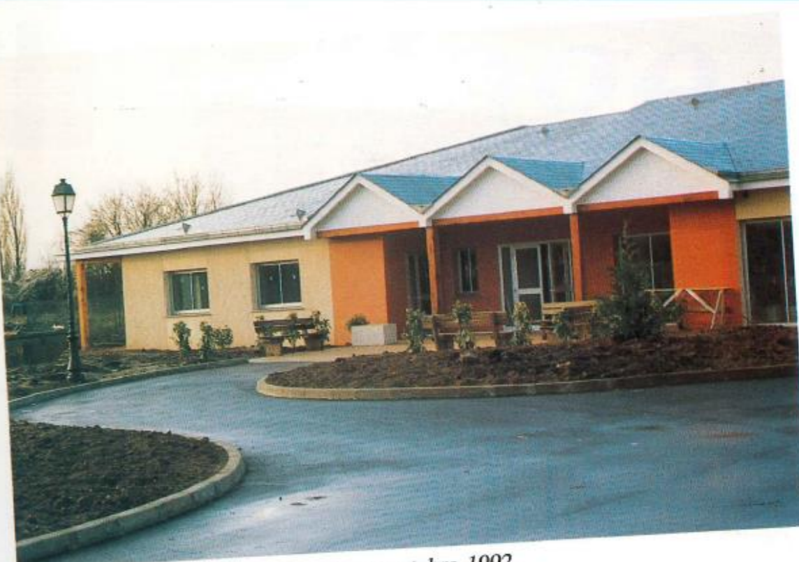
Crèche quarante berceaux : ouverture octobre 1992.