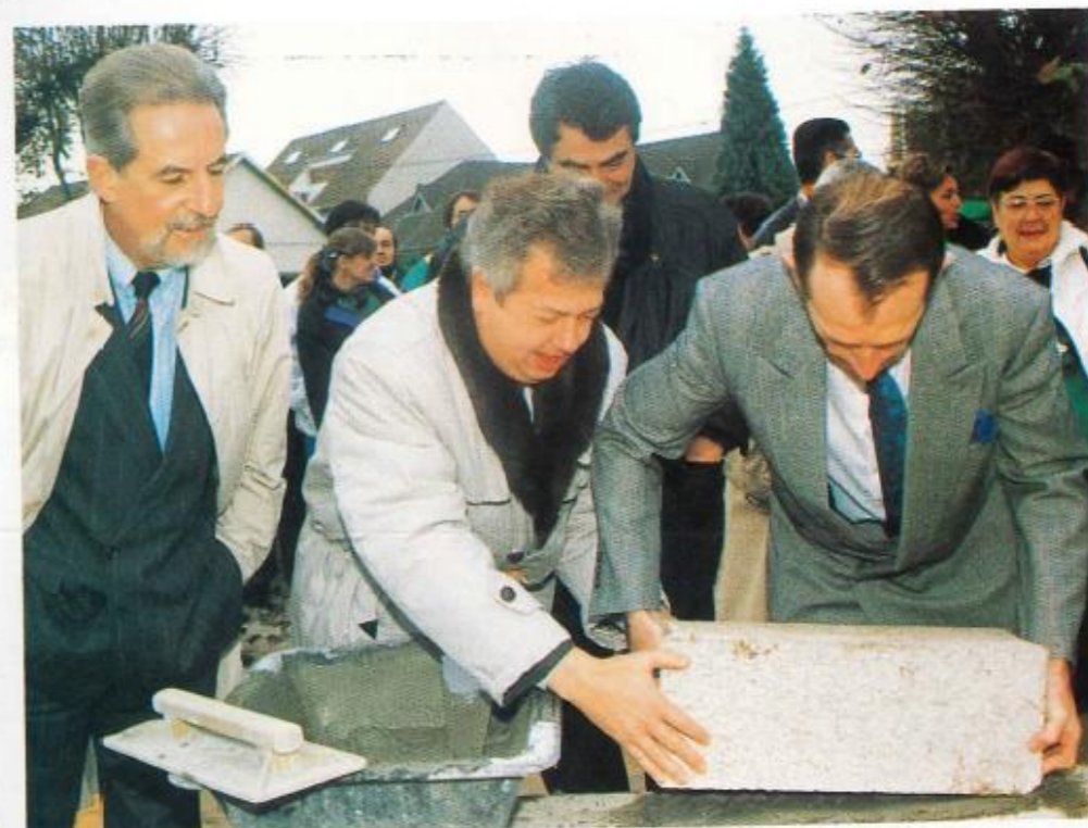
Première pierre du Centre Aéré : ouverture prévue 1 er juillet 1992.