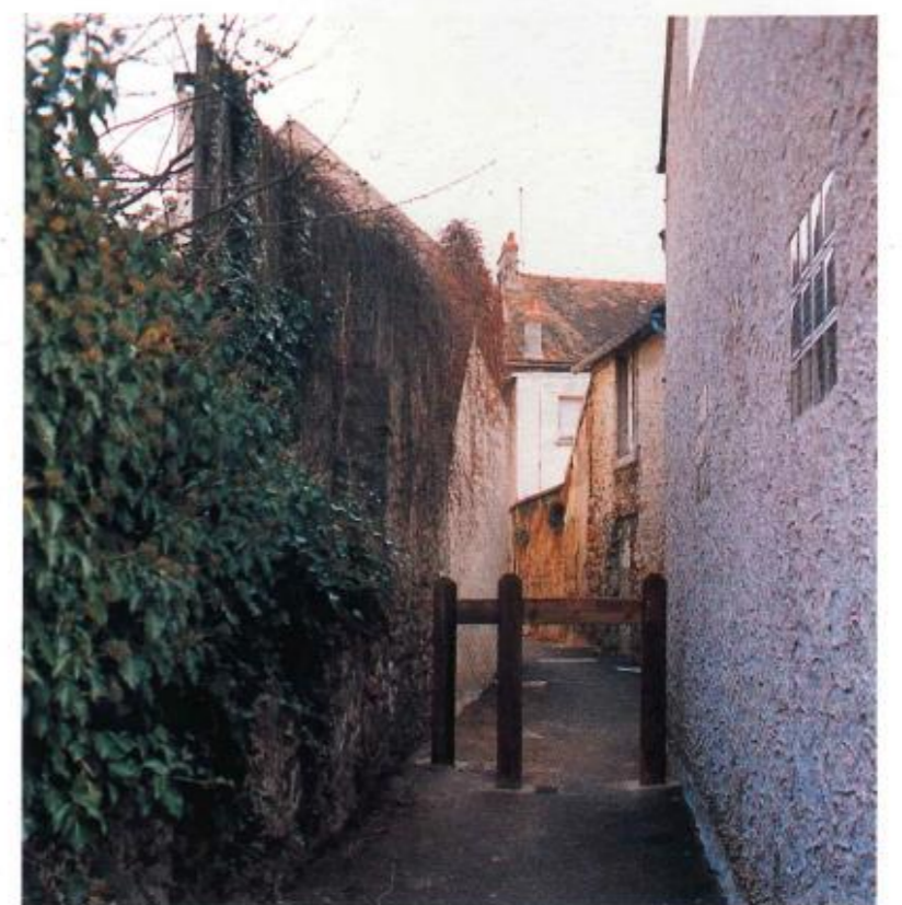
Réfection de la ruelle Grandjean-Lemeunier