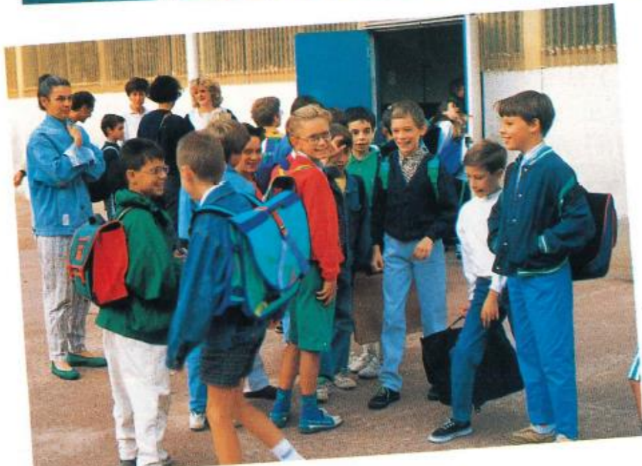
Rentrée scolaire 1991.