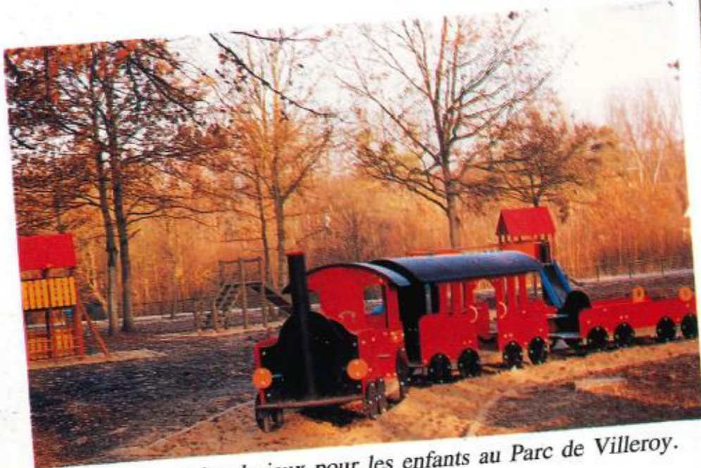
Création d'une aire de jeux pour les enfants au Parc de Villeroy.