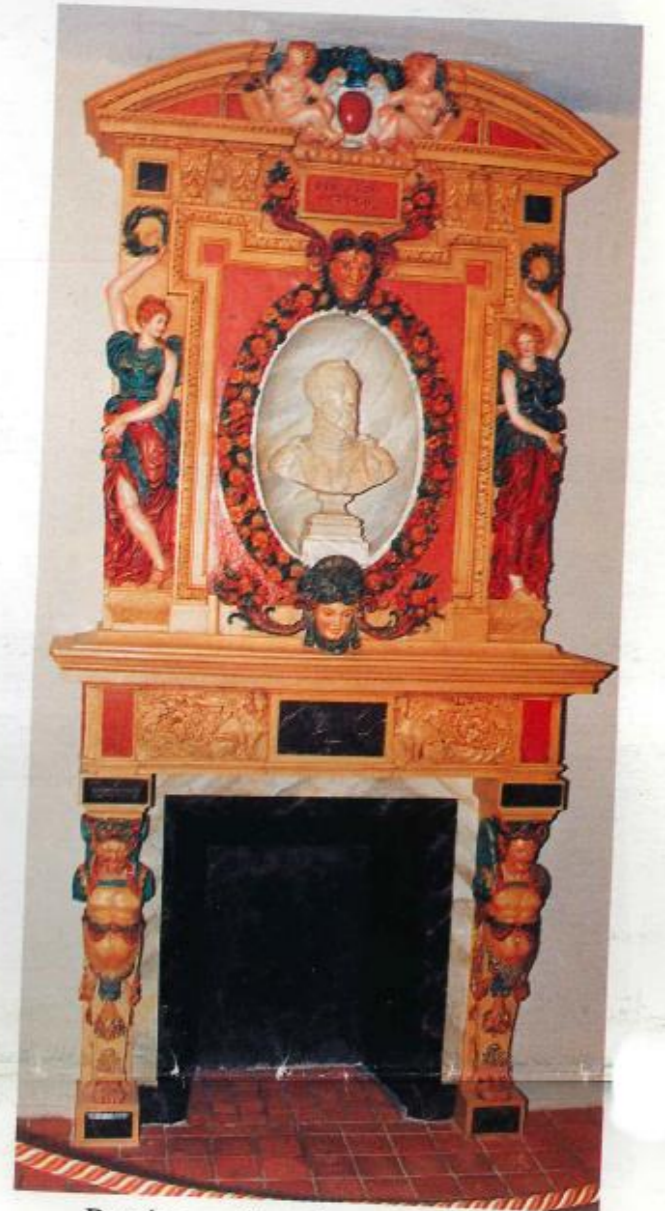
Remise en état d'une copie de la « Belle Cheminée » de l'ancien château des Ducs de Villeroy.