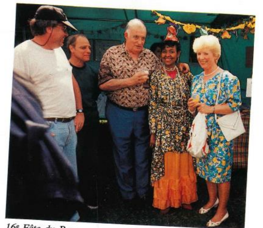
16 e Fête du Parc.