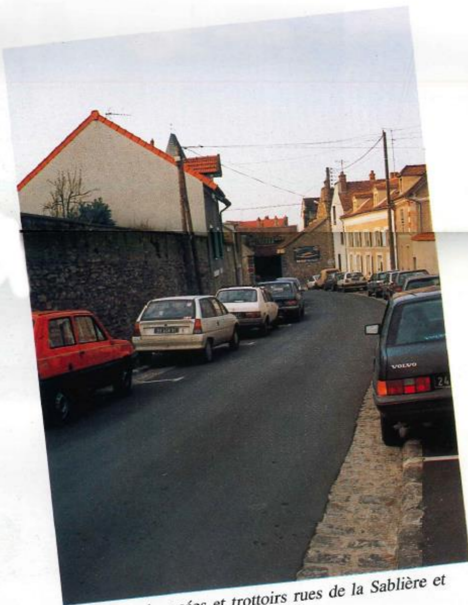
Réfection chaussées et trottoirs rues de la Sablière et des Ecoles.