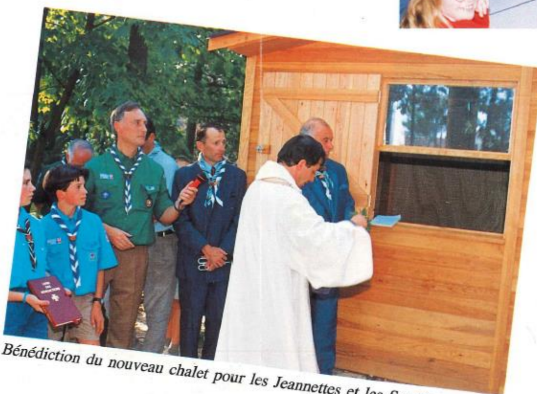
Bénédictio du nouveau chalet pour les Jeannettes et les Scouts.