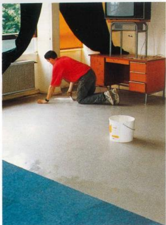
Pose de moquette dans toutes les salles de l'école primaire de la Verville.

Ouverture 1 er mars vous pourrez venir nager dans la PISCINE OLYMPIQUE