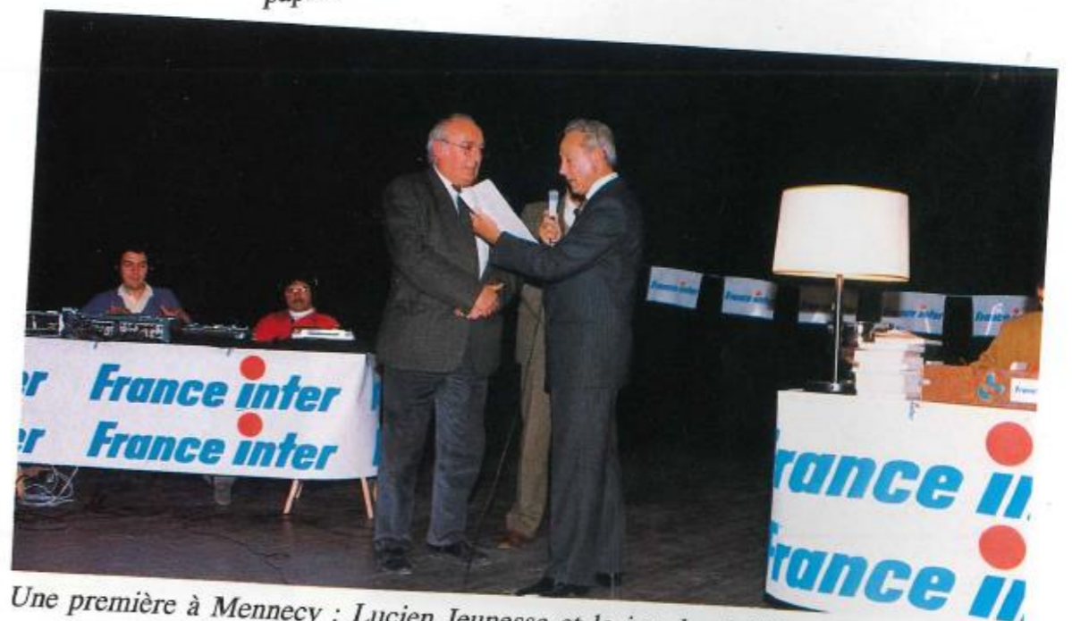
Une première à Mennecey : Lucien Jeunesse et le jeu des 1 000 Francs.