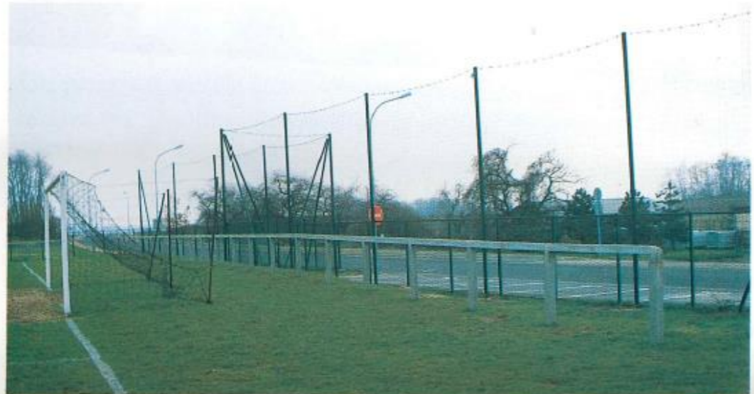
Les nouvelles installations du stade Paul Cézanne.