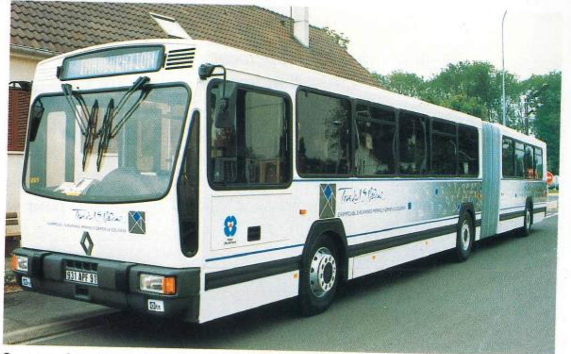
Inauguration de nouvelles lignes et de nouveaux matériels des lignes régulières n°24-11 et 24-12.