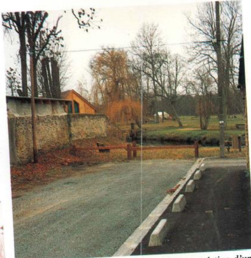
Aménagement de la rue de l'Abreuvoir et création d'un petit square.