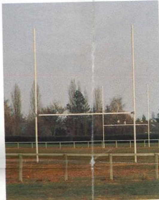
Ouverture d'un terrain de rugby au quartier des Myrtilles.