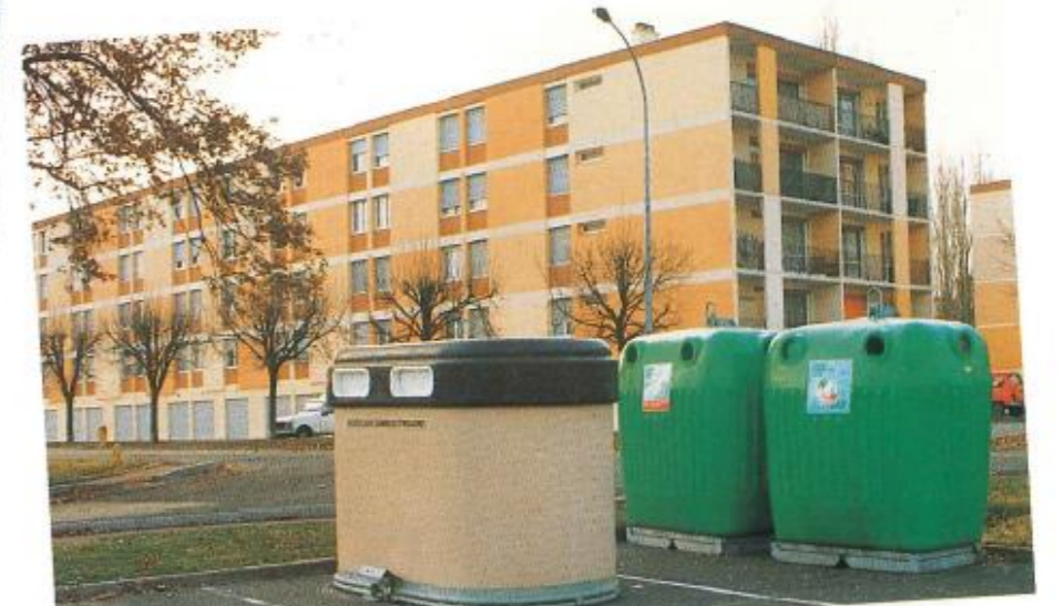
Opération Ville propre : 21 conteneurs verre et 8 conteneurs papier.

4, rue de la République - 91540 Mennecey