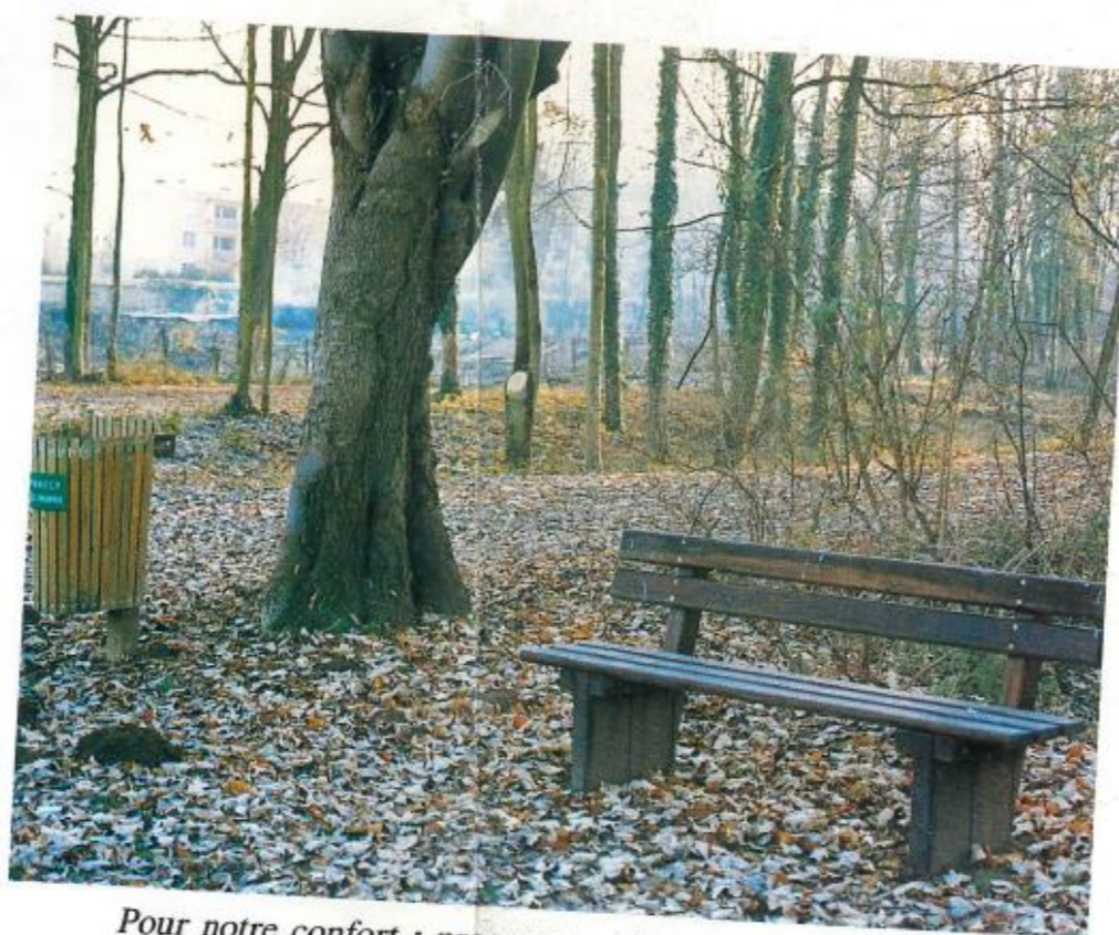
Pour notre confort : programme d'implantation de bancs