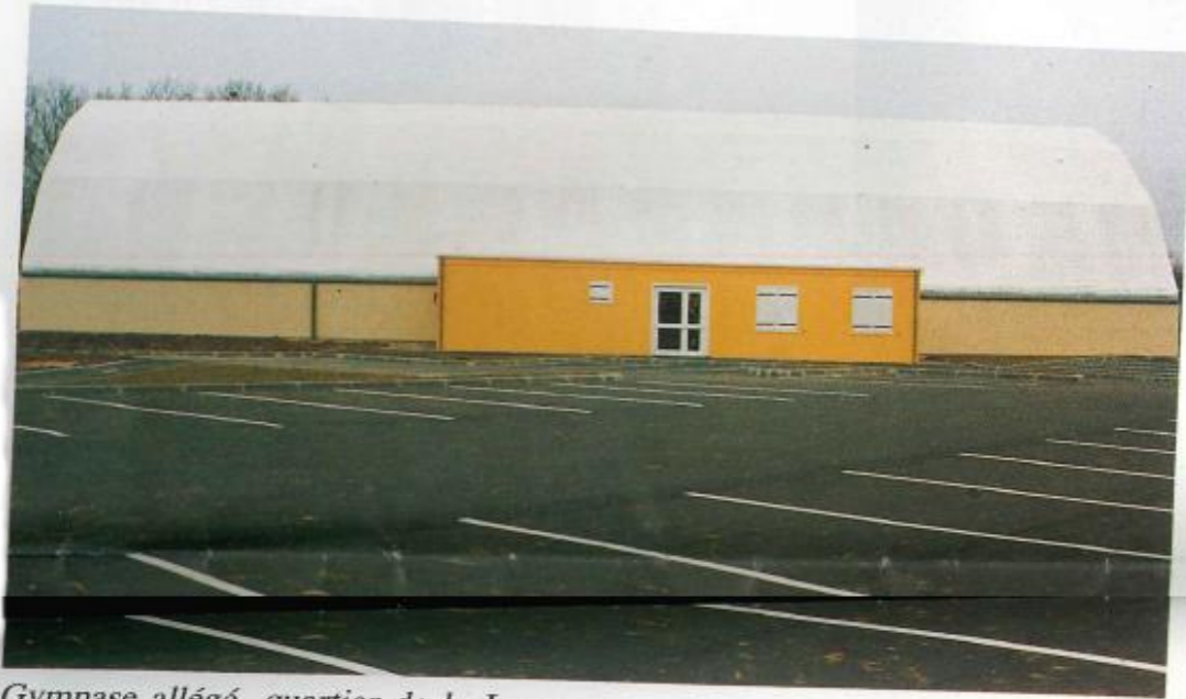
Gymnase allégé, quartier de la Jeannotte.