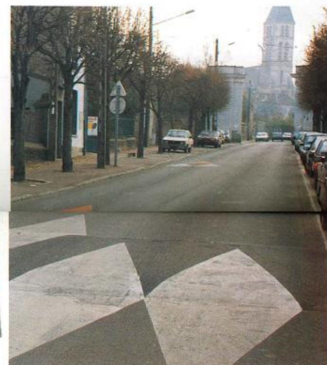
Programme de ralentisseurs pour la sécurité des piétons.