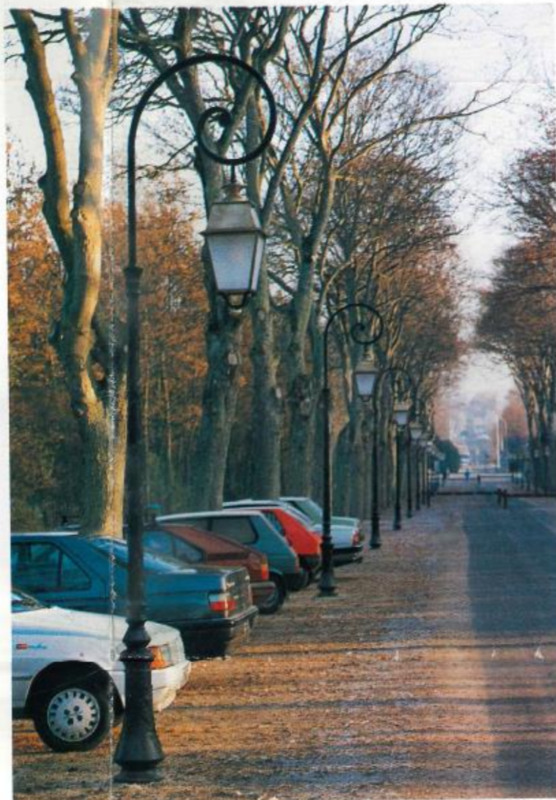
Rénovation de l'allée des Sycomores. Réalisation d'un éclairage axial.