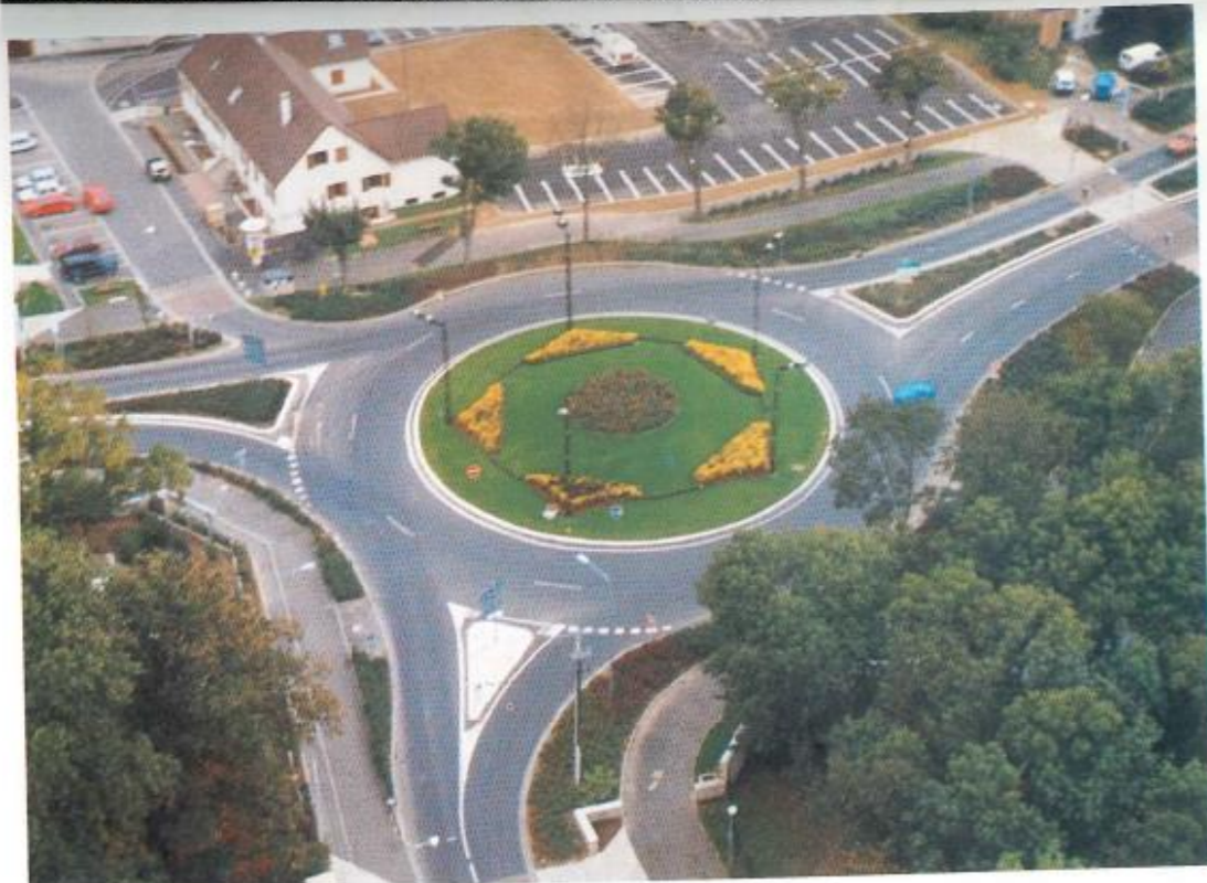
Carrefour pilote : carrefour de l'Europe.