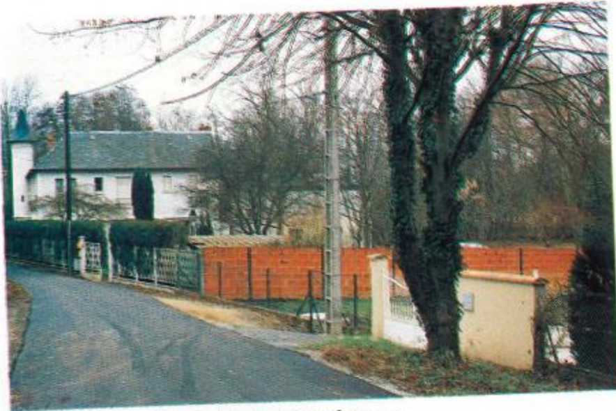
Réfection du chemin de la Manufacture.