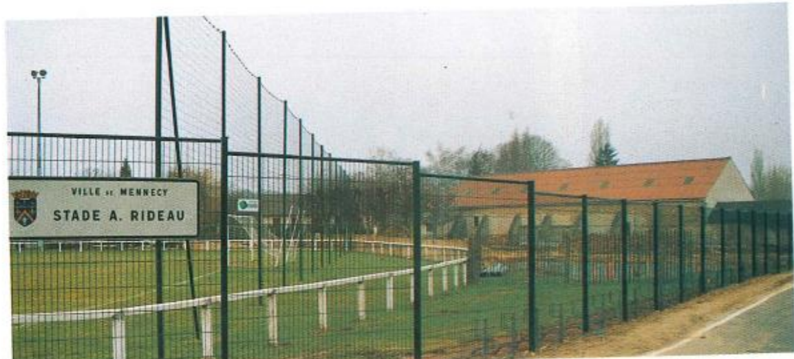
Des équipements neufs : clôtures, chalets pour les boulistes et footballeurs.