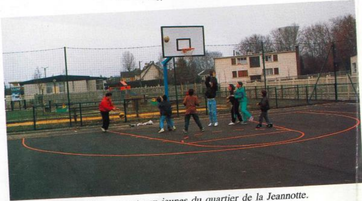
Terrain de basket libre ouvert aux jeunes du quartier de la Jeannotte.