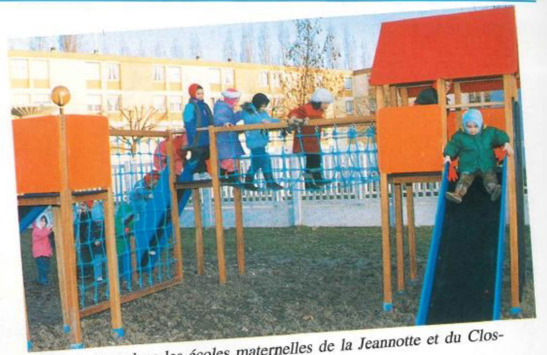
Aires de jeux dans les écoles maternelles de la Jeannotte et du Clos-Renault.