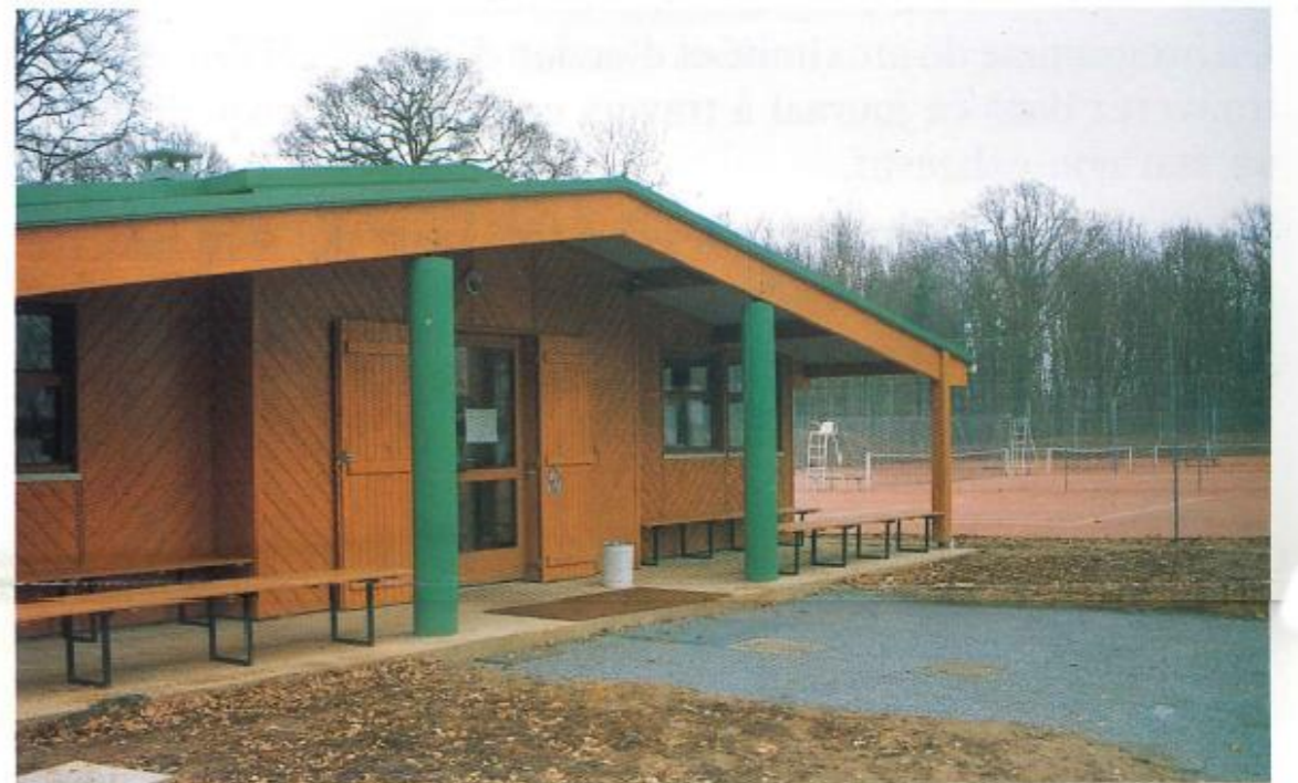
Réalisation d'un club-house et de deux nouveaux courts de tennis.