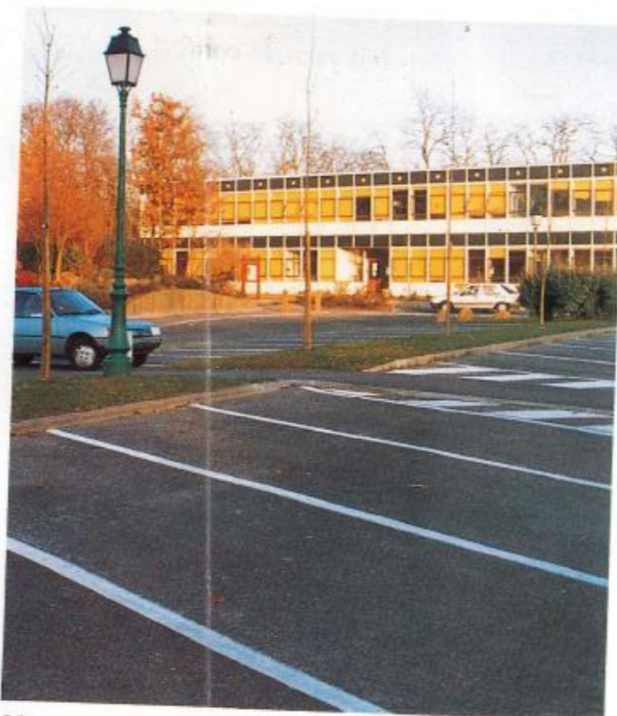
Nouveaux parkings et aménagements de sécurité à l'école de la Verville.

Ouverture 1 er mars vous pourrez venir nager dans la PISCINE OLYMPIQUE