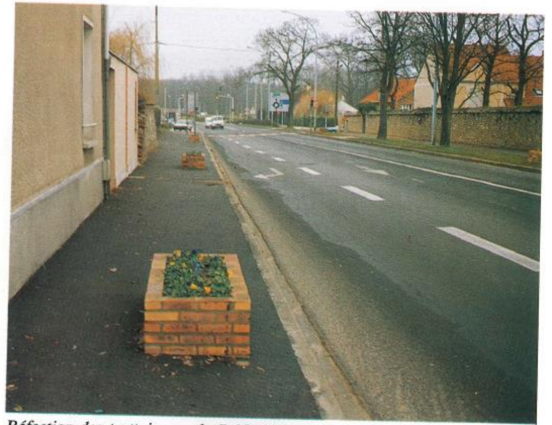
Réfection des trottoirs sur le R.N. 191.