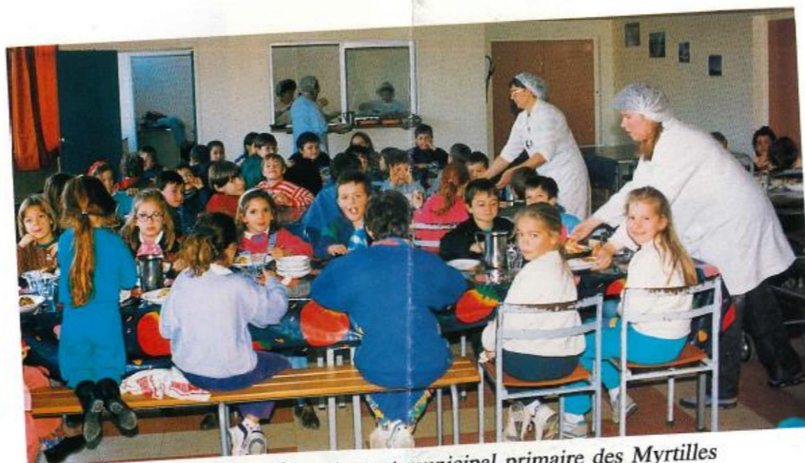
Aménagement du restaurant municipal primaire des Myrtilles