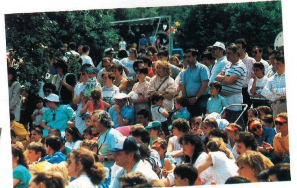
16 e fête du Parc : un succès confirmé.