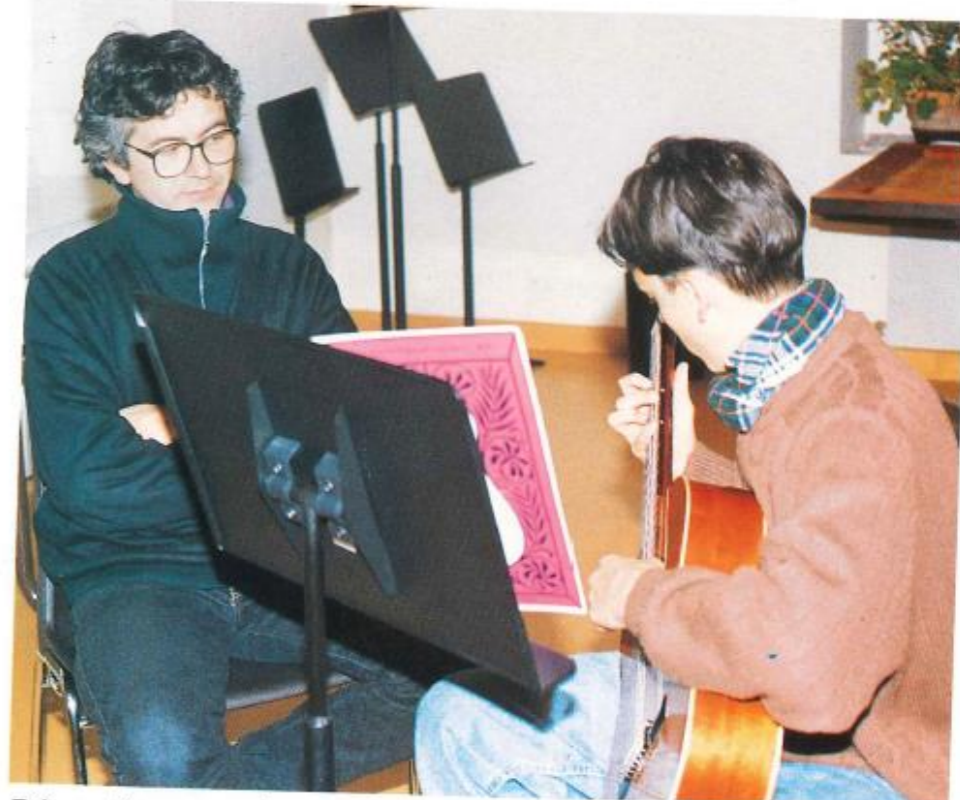
Rénovation et aménagements à l'Ecole Municipale de Musique.