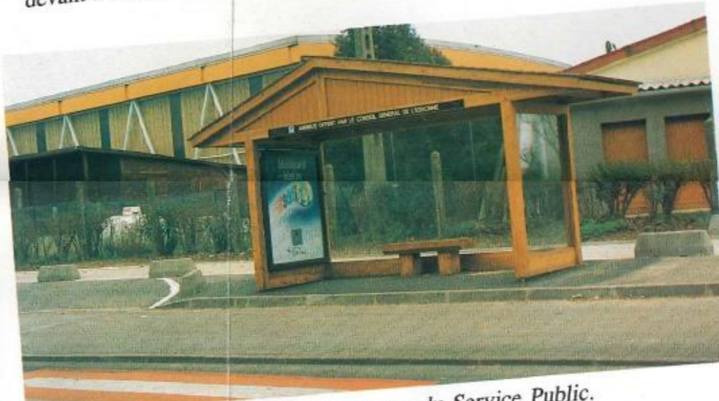
Abris-bus pour le confort des voyageurs du Service Public.