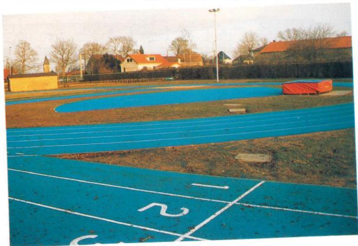
Eclairage et pistes synthétiques d'athlétisme.