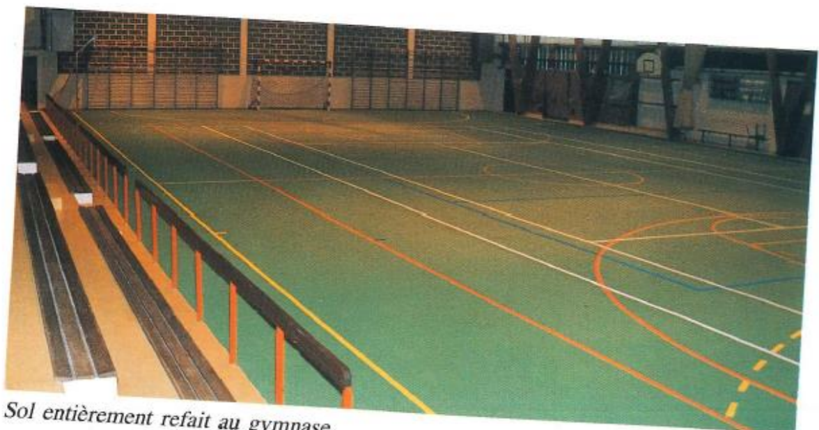
Sol entièrement refait au gymnase.