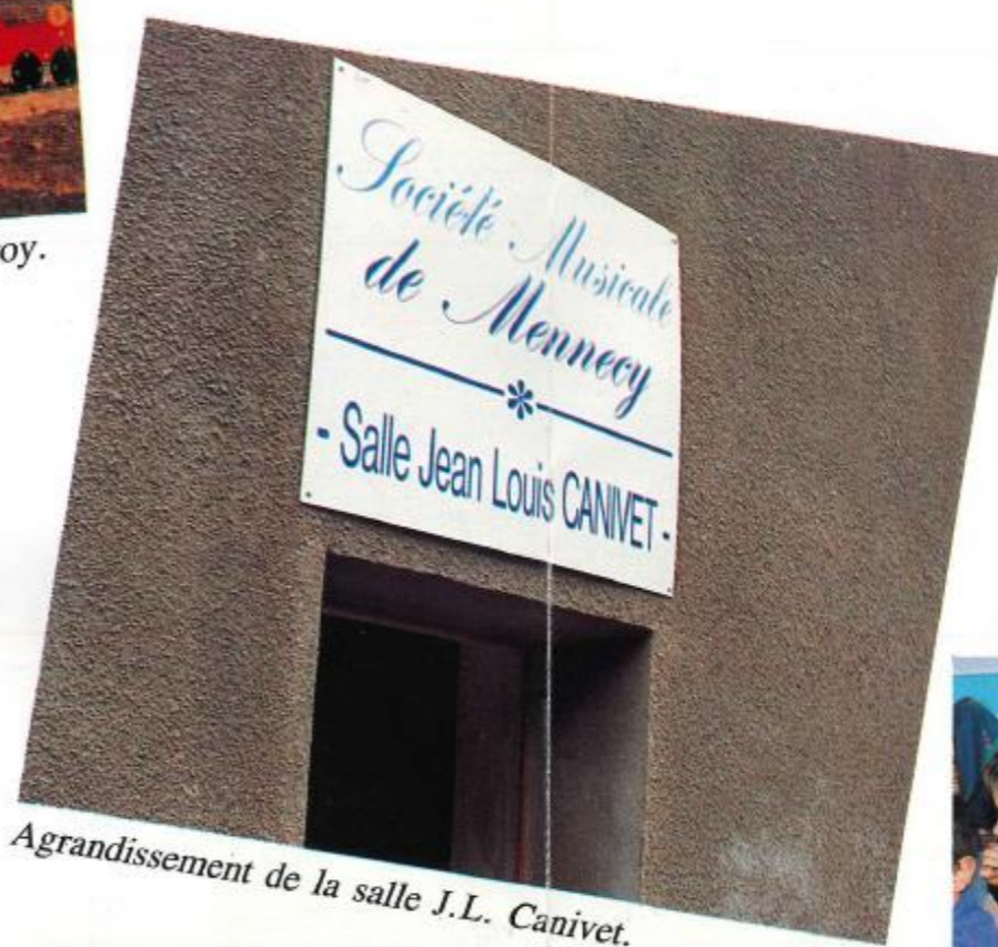
Agrandissement de la salle J.L. Canivet.