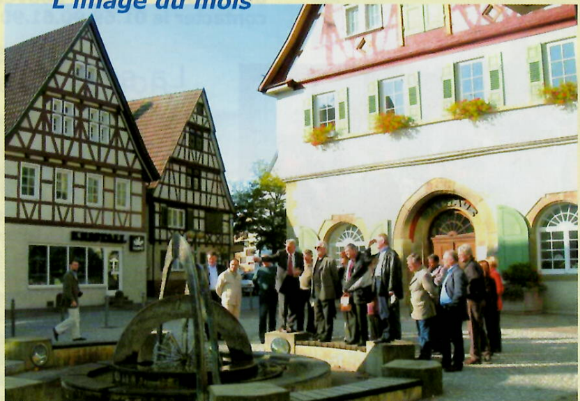
La délégation devant la mairie de Renningen.