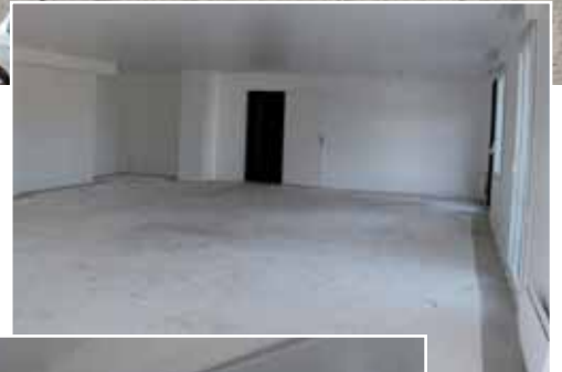
Salle Jean-Claude Volland