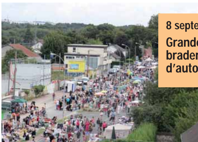
8 septembre Grande braderie d'automne