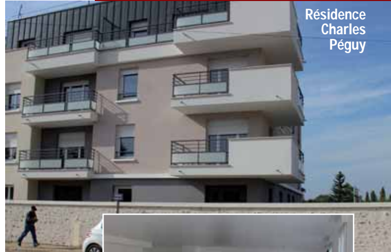
Résidence Charles Péguy