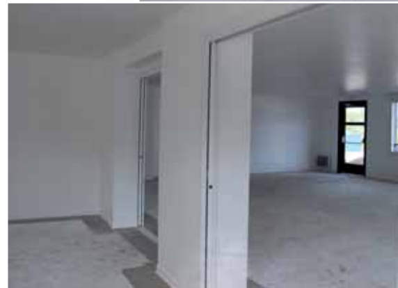
Salle Gilberte Martin