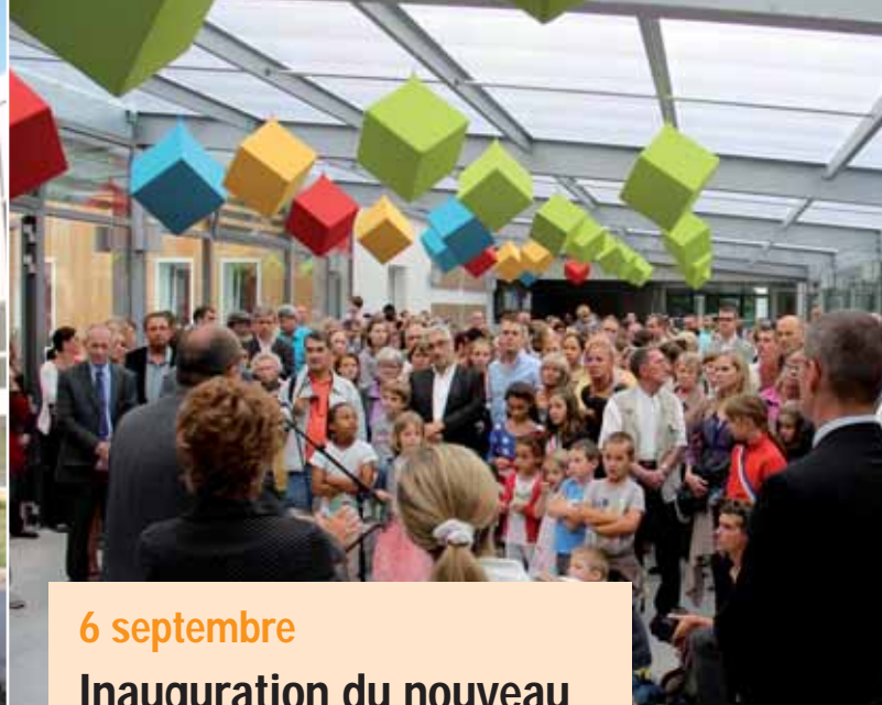
6 septembre Inauguration du nouveau groupe scolaire "Colline de Verville"