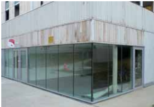
Salle Alexandre Thobois