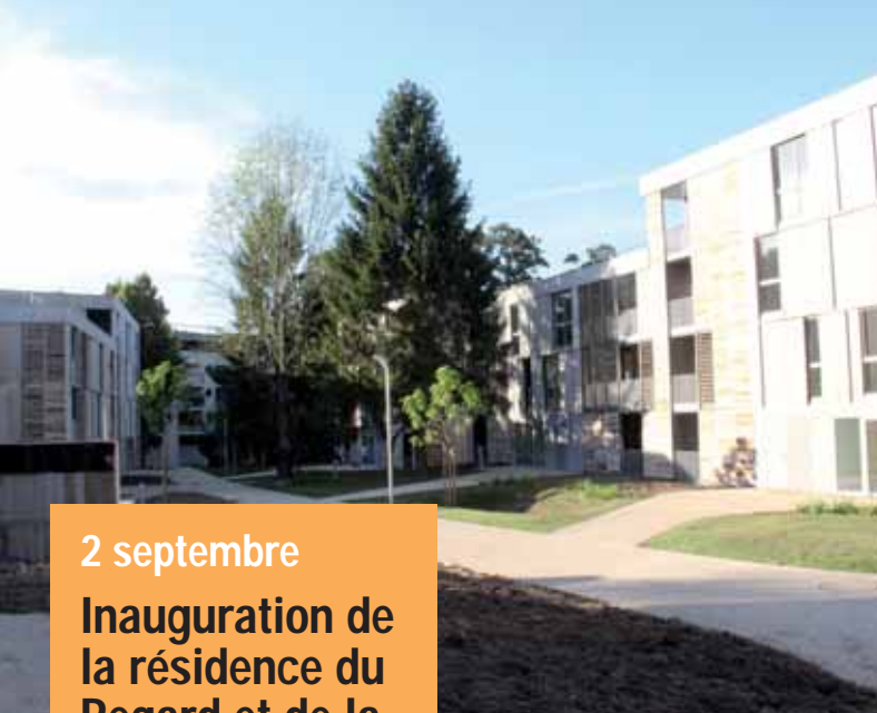
2 septembre Inauguration de la résidence du Regard et de la salle Alexandre Thobois Avenue de Villeroy.