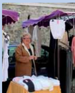
Armelle Vêtements féminins