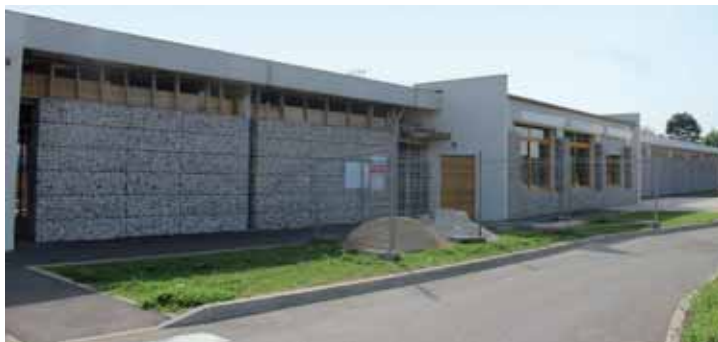
Nouvelle salle de bridge (Ecole des Myrtilles)