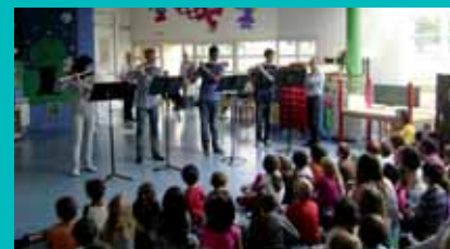
Concert du 26 juin 2013 au centre de Loisirs

En fin d'année scolaire, tous les enfants du centre aéré Joseph Judith assisteront à un concert offert par les professeurs du conservatoire Joël Monier.