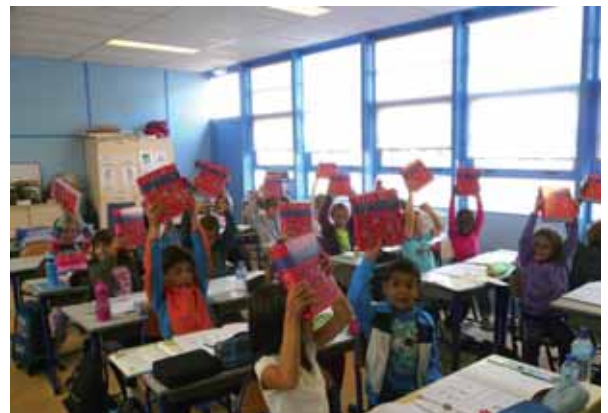
10 septembre Distribution d'un dictionnaire à tous les élèves de CE1.