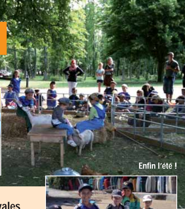
Enfin l'été !