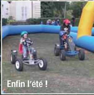
Enfin l'été !